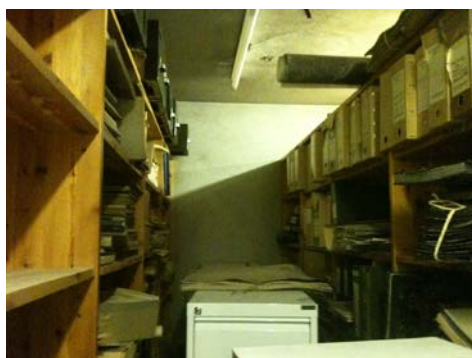
Kartlegging av arkivlokaler