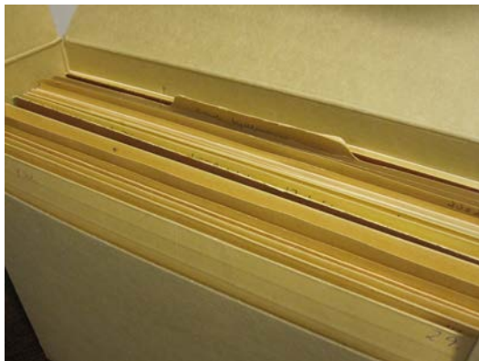
Klientmapper i arkivboks

Kommunene behandler store mengder personopplysninger som inngår i personregistre som bl.a. innen sosial, barnevern, oppvekst, helse. Personregistre, klientmapper som er gått ut av administrativt bruk, kan deponeres hos IKA Finnmark hvor personopplysningene forvaltes etter lovverket i henhold til oppbevaring, ordning, katalogisering og behandling av innsynsforespørsler.