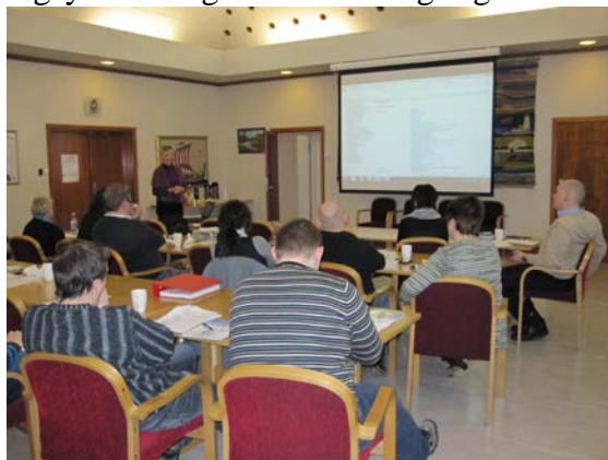
Arkivkurs i Vardø 2011

12 medlemskommuner er blitt besøkt med til sammen 14 besøk hvor IKA Finnmark har hatt møter med arkivleder/ arkivtjenesten, IT – konsulent og enkelte rådmenn