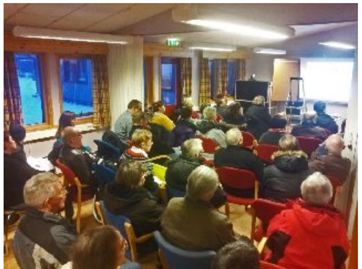
Arkivdagen engasjerte oss med foredrag og utstilling