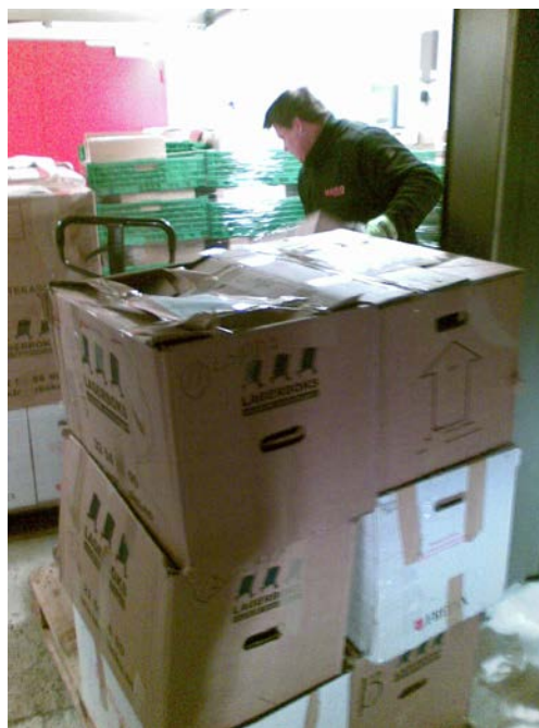
Avlevering fra Sør-Varanger, 2011

IKA Finnmark har i 2011 arbeidet spesielt aktivt for å bistå kommuner som tidligere ikke har fått deponert eldre arkiv til depot.